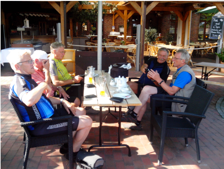
... eine kleine Stärkung im Gasthof 'Antonslust' in Langwerth