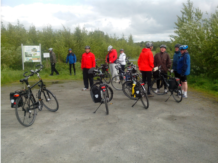
... Info-Pause beim 'Moorwald' in Bollenhagen

Mittwoch. 07. Mai 2014 , 15:00 - ca. 18:50 Uhr: