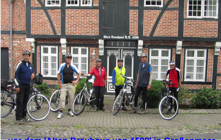
... vor dem 'Alten Brauhaus von 1599' in Großenmeer