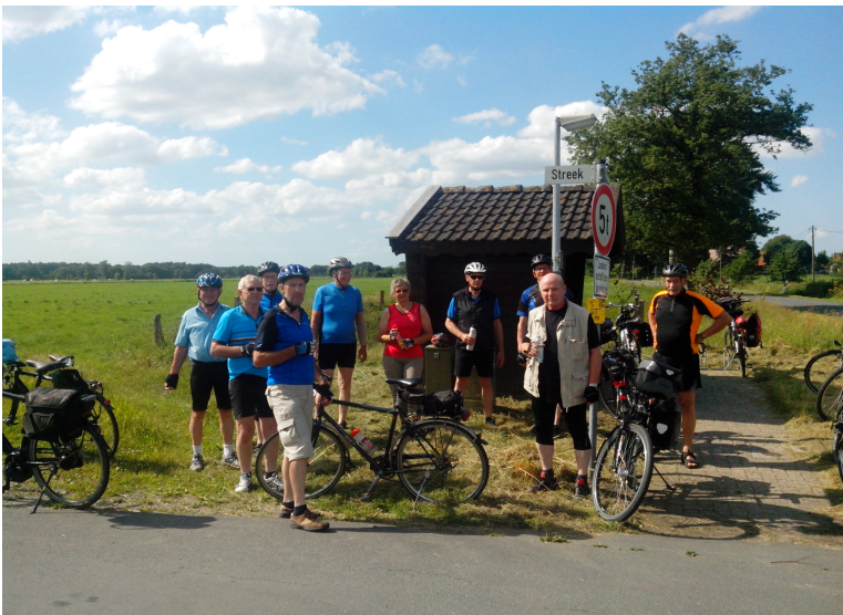
... die Energiespeicher wurden in Petersfeld aufgeladen