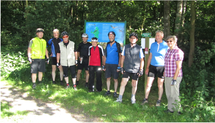
... Pause beim Waldeingang in Grabstederfeld

Mittwoch. 11. Juni 2014, 15:00 - ca. 19:45 Uhr: