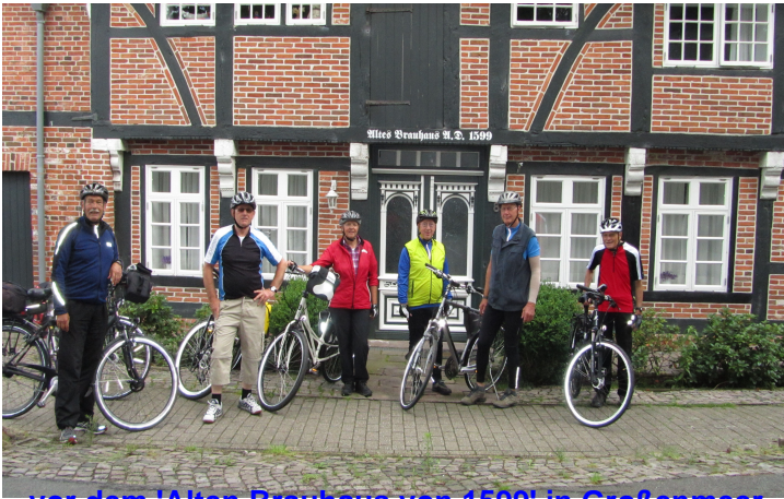
... vor dem 'Alten Brauhaus von 1599' in Großenmeer