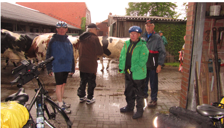
... kurzer 'Regenstopp' auf einem Bauernhof in Bohlenberge