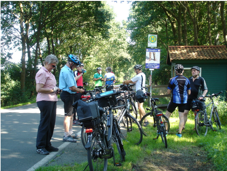
.... kurzes 'Auftanken' in Nordbollenhagen