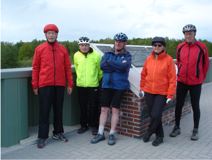
... beim 'Schwimmenden Moor' in Sehestedt

- Reitland - Sehestedt - Norderschweiburg - Diekmannshausen - Vareler Hafen - Varel - Streckenlänge: ca. 51 km