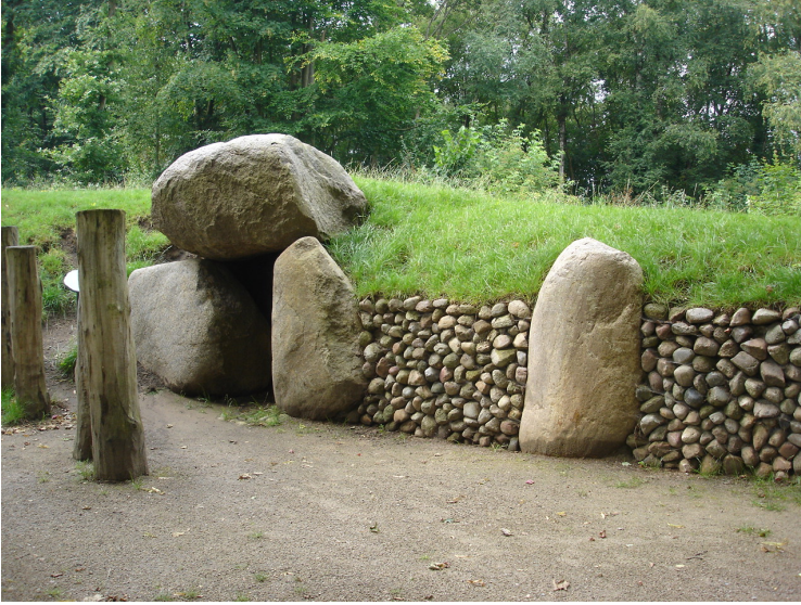
... das Großsteingrab in Aurich-Tannenhausen

... vor der 'Ostfriesischen Landschaft' in Aurich