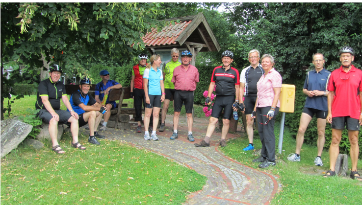
... kurze Erholungsphase in Ellenserdammersiel