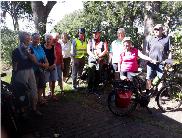
... die Gruppe G15 beim Pausenstopp in Neuenburgerfeld

Freitag, 07. Aug. 2020 - Start um 13:30 Uhr Trainingsfahrt