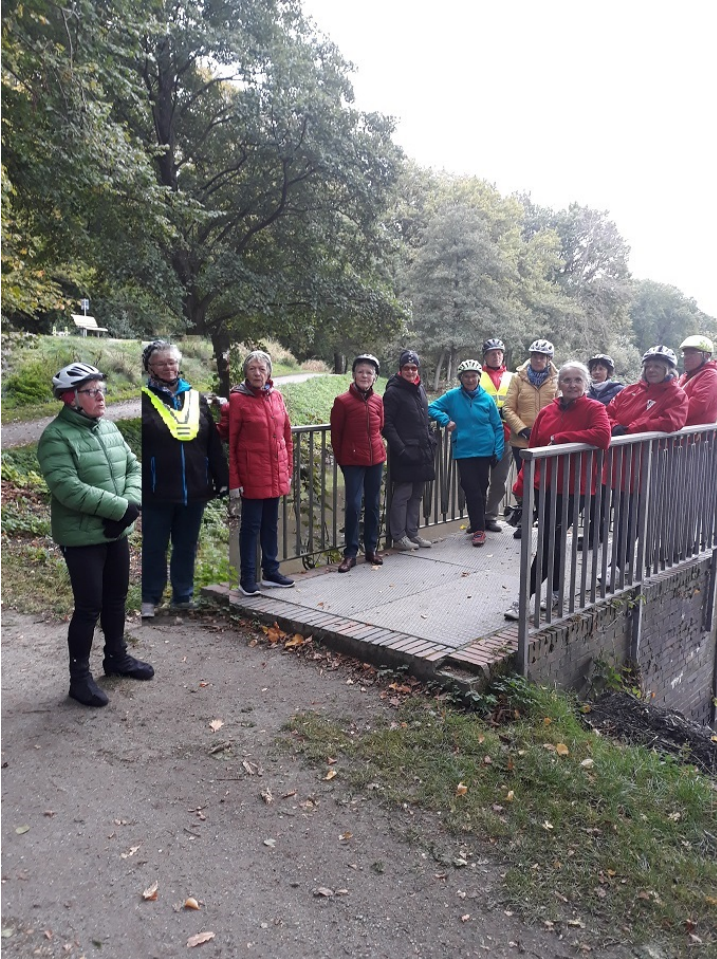
... die Gruppe G15 beim 'Ellerteich' in Rastede

Freitag, 09. Okt. 2020 - Start um 13:00 Uhr