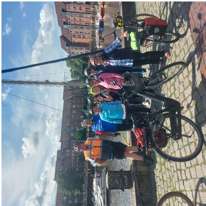
... die G15-Gruppe beim Hafen in Oldenburg