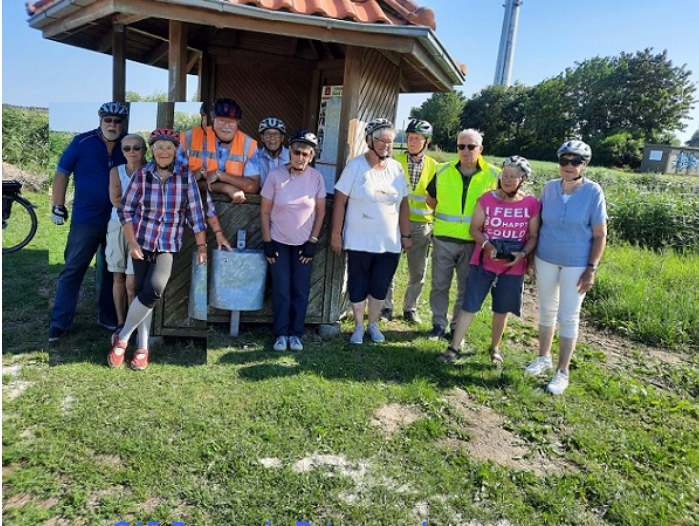
... unsere G15-Gruppe in Petersgroden