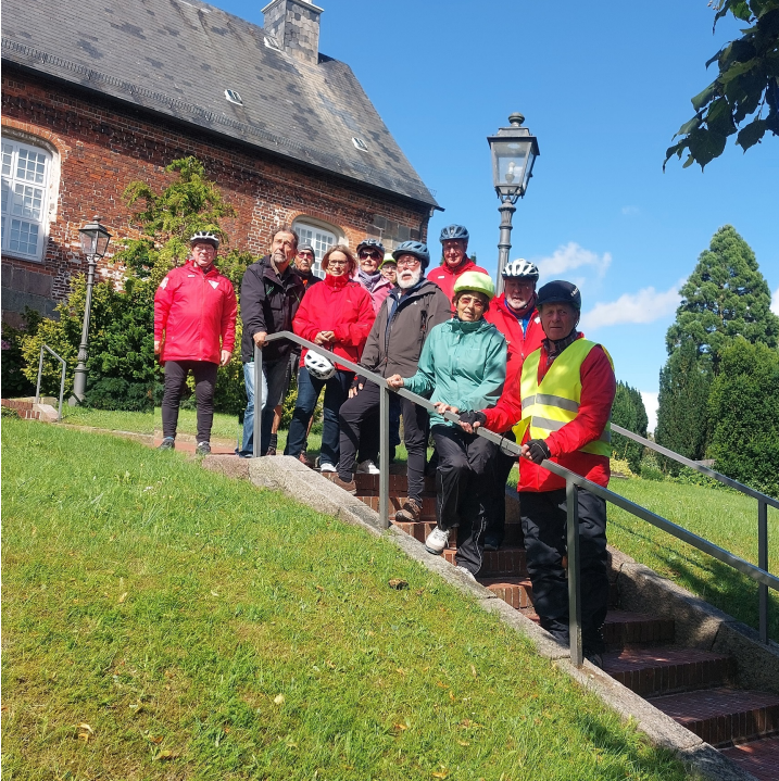
... die G15-Gruppe bei der St.-Martins-Kirche in Zetel

Varel – Borgstede - Winkelsheide - Dangastermoor - Dangast Hafen - Petersgroden - Ellenserdamm - Ellens - Zetelermarsch - Zetel (hier: Kaffeepause beim Backhaus Frölje) - Bockhorn - Segnorn - Borgstede - Varel _Streckenlänge: ca. 46 km