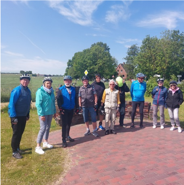
... unsere G18/20-Gruppe an diesem Tag (bei Langwarden Skulpturen)