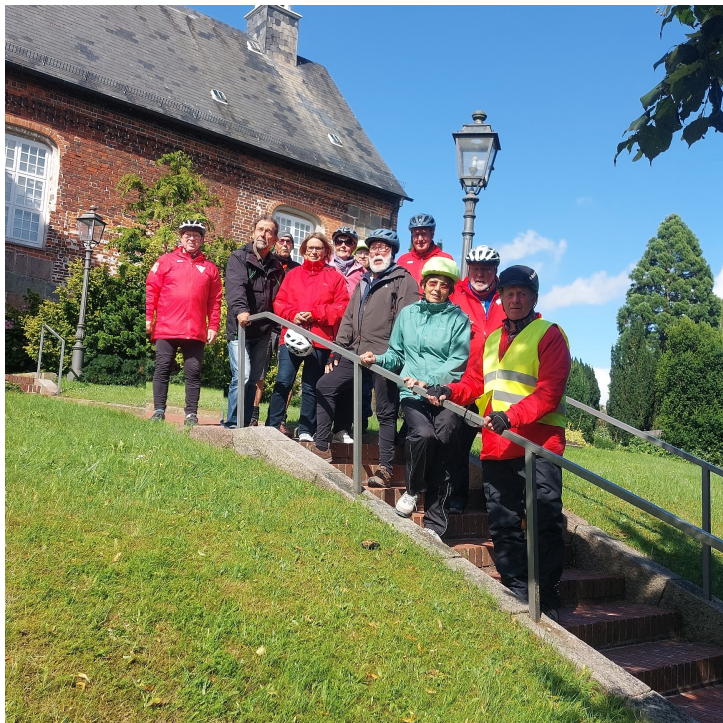
... die G15-Gruppe bei der St.-Martins-Kirche in Zetel

Varel – Borgstede - Winkelsheide - Dangastermoor - Dangast Hafen - Petersgroden - Ellenserdamm - Ellens - Zetelermarsch - Zetel (hier: Kaffeepause beim Backhaus Frölje) - Bockhorn - Segnorn - Borgstede - Varel _Streckenlänge: ca. 46 km