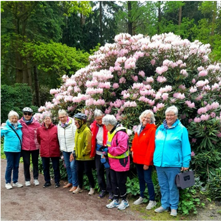
... die G15-Gruppe im 'Rhodo-Park Gristede'