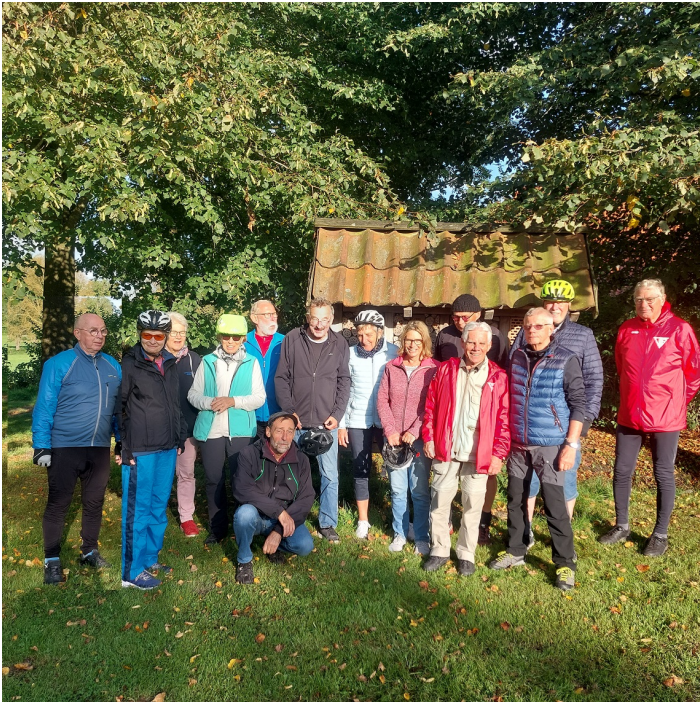
... die G18/20-Gruppen genießen die Abendsonne in Grabstede