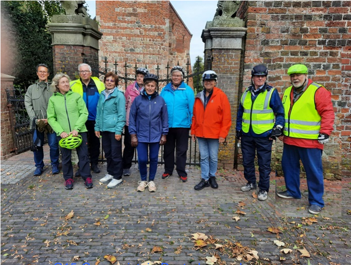
... unsere G15-Gruppe ist in Rastede angekommen

Samstag, 30. Sept. 2023 - Start um 13:30 Uhr - Trainingsfahrt: