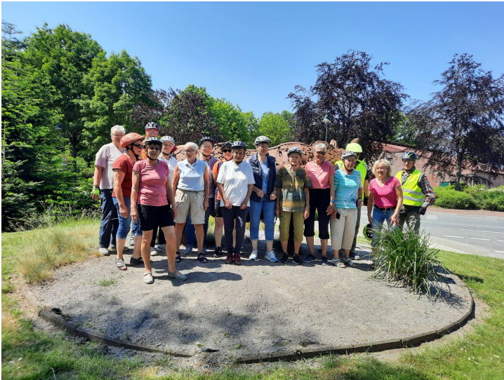
... die G15 Gruppen beim 'Nashorn' in Spohle

Varel - Obenstrohe - Rosenberg - Spohle - Dringenburg - Hollen - Wiefelstede (hier: Kaffee- bzw. Eis-Pause) - Nethen - Bek- hausen - Jaderberg - Büppel - Varel - Streckenlänge: ca. 50 km