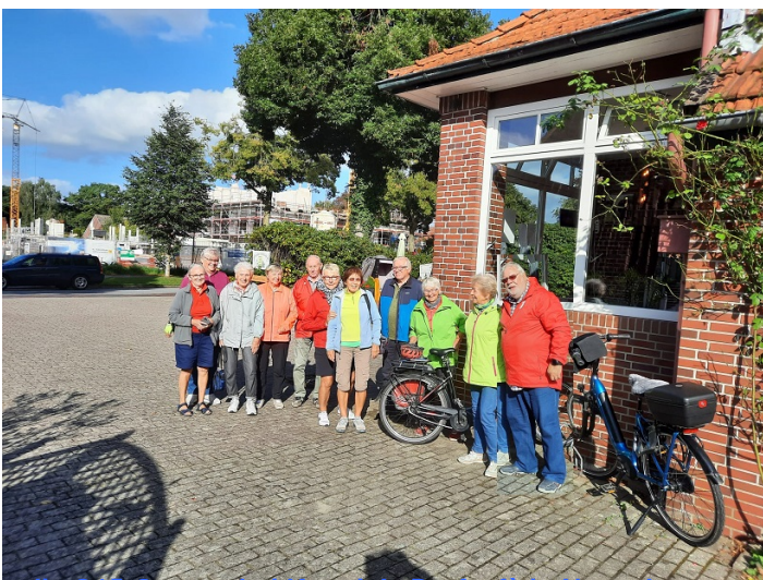
... die G15-Gruppe bei Kerstin's Dorfcafé in Neuenburg