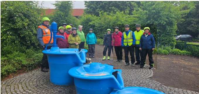
... die G15-Gruppe beim 'Wasserlehrpfad' in Nethen

Varel - Neuenwege - Heubült - Bekhausen - Nethen (Frühstückspause und Rundgang beim Wasserlehrpfad - Wiefelstede - Gristede (Besichtigung Rhododendronpark), Aschhausen - Kayhauserfeld (Mittagspause bei Fisch Bruns) - Bad Zwischenahn - Eyhausen - Dreibergen - Gristede - Wiefelstedermoor - Hollen - Dringenburg (große Rhododendrenfelder) - Spohle - Conneforde - Neuenwege I - Varel Streckenlänge ca 85 km