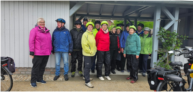
... die G15-Gruppen bei der "Pausenhütte" in Bekhausen

Mittwoch, 29. April 2026 - Start um 13:30 Uhr: